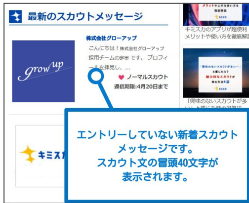
◀ 学生からの見え方 ブラウザ版